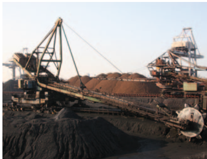
↑ Vasérc és kőszén kitermelése