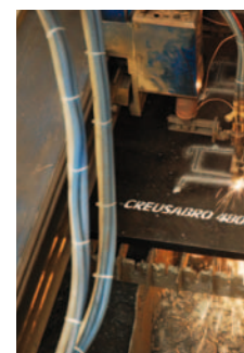
↑ Alkatrészek plazma vágása