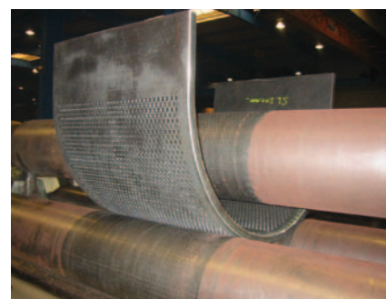
↑ Szita hajlítása

— Mi az egész csoportunk technikai tudását és tapasztalatát kínáljuk Önnek, alapanyagok és megmunkálási lehetőségek széles választékát, hogy a legmegfelelőbb és legköltséghatékonyabb megoldást ajánlhassuk Önnek.