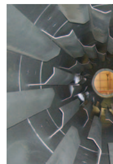
↑ Csavaros szállítószalag

— Azáltal, hogy az Abraservice csoport egész Európában elérhető, a csoport olyan ügyfelek igényeit is megismeri, akik rendkívül speciális környezetben dolgoznak és nélkülözhetetlen számukra a minőség és tartósság: acélipar, bányák és kőfejtők, cementgyárak, kezelés, emelés és szállítás, általános építőmérnöki munkák, cukorgyárak, mezőgazdasági berendezések, papírgyárak.