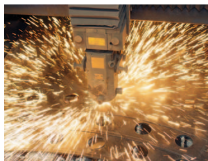
↑ Perforált lemez plazma vágása