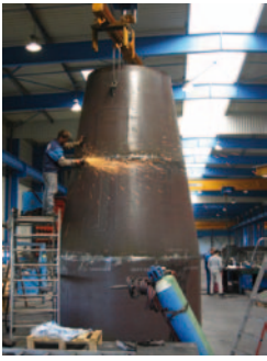
↑ Összesítő tárolótartály gyártása